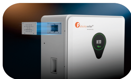
Konstrukcja zewnętrznego bezpiecznika akumulatorowego