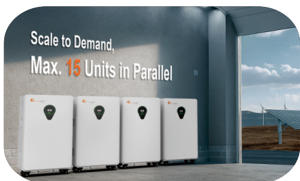
Obsługa do 15 sztuk w równoległym połączeniu