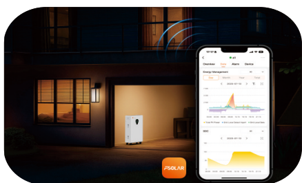
Monitorowanie w czasie rzeczywistym